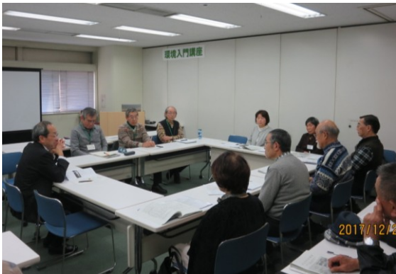
環境入門講座6日目（12/20）講座のおさらい・質疑応答