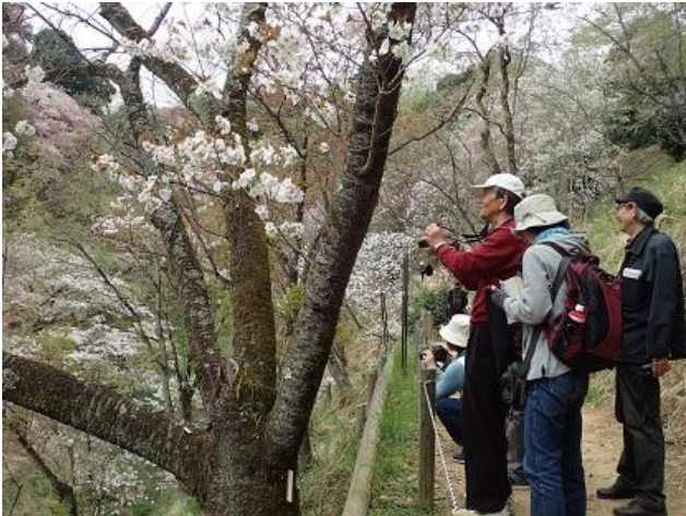
4月公開部会（4/17）の「サクラ保存林」見学の模様