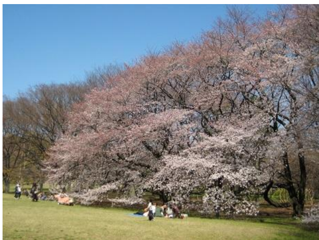
砧公園の桜 4月上旬