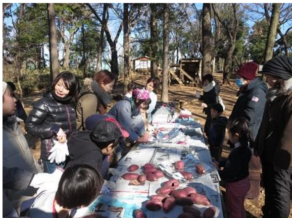
エコアップ探検隊冬編 (1/24) 焼き芋づくり